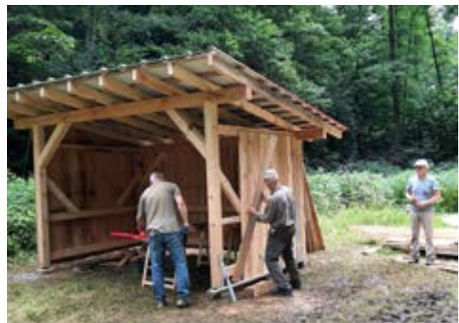
Mit tatkräftiger Unterstützung des Schwarzwald- und Bürgervereins wurde der Holzunterstand errichtet.