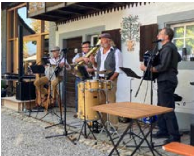
Die Gruppe „Augustinum“ trägt wieder zum musikalischen Ausklang bei.

Von den Betreiber:innen erbitten wir eine Kuchenspende. Tische, Stühle, Sonnenschirme und Schutzzelte sind für einen Teil der Stände - nach Absprache - vorhanden. Parken bitte beim Sportplatz (ca. 300 m).