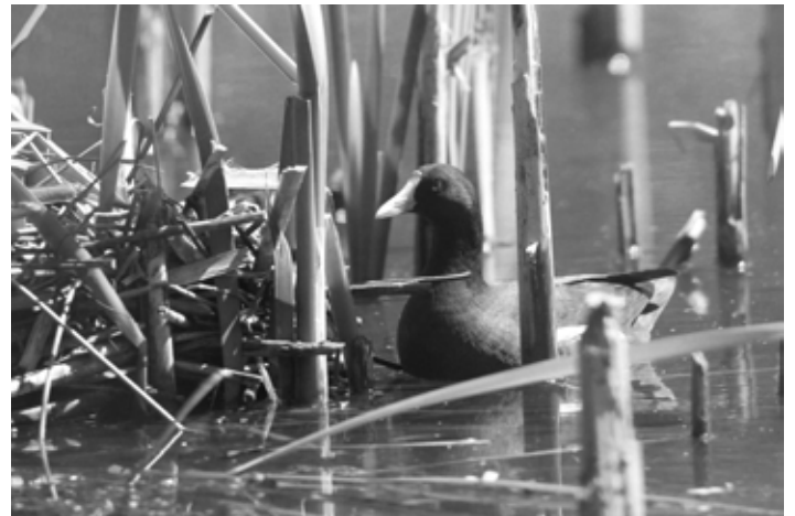
Beim Nestbau (Ende Mai)

Ende Mai hatten die erwachsenen Teichhühner ihr Nest mitten in einem der Teiche gebaut. Vier bis fünf Jungvögel konnten schlüpfen. Die Jungen entwickelten sich prächtig, wie die Bilder zeigen. Teichhühner sind Allesfresser. Sie fressen unter anderem die Samen und Früchte von Sumpf- und Wasserpflanzen, aber auch Insekten und Würmer.