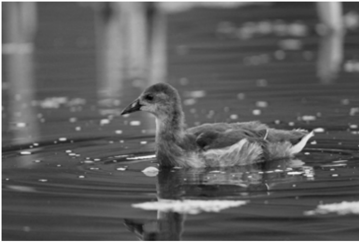
Vier bis fünf Wochen alter Jungvogel (August)