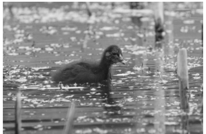
Wenige Tage altes Jungtier (Juli)